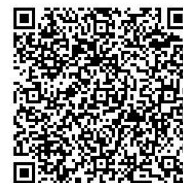
沖縄県電子申請サービス