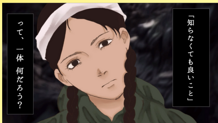
2024年 ひめゆり映像賞受賞作品 「Flower that never dies」 晃華学園高等学校Aチーム

ひめゆり平和研究所は「第8回 "ひめゆり" を伝える映像コンテスト」を開催します。 ひめゆり学徒隊や沖縄戦について、感じたり、学んだり、考えたりしたことを映像で発表してみませんか。 ドキュメンタリー、アニメーション、ドラマなどのほか、歌やダンス、ラップなどのパフォーマンスなど、 表現方法は自由です。プロ・アマ、年齢問いません。テーマに沿った10分以内の作品をご応募ください！